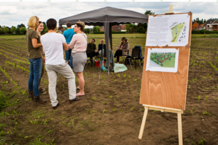
Indien er al een site is, kan de Samenhuizendag daar georganiseerd worden.