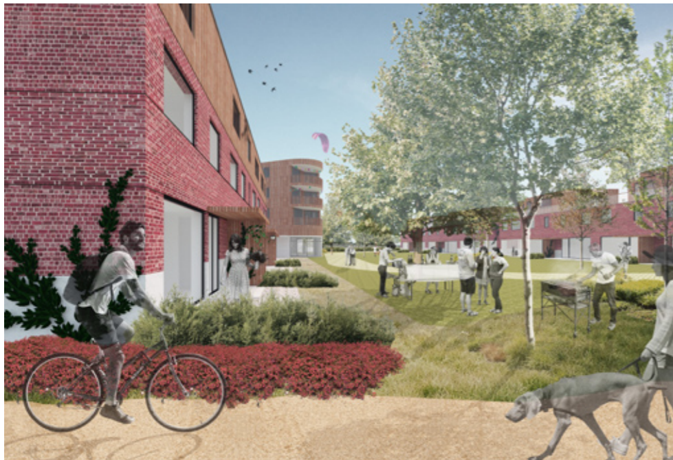
Voorontwerp door DAM Architecten

DE ARK is actief op zoek gegaan naar manieren waarop de groep kandidaatbewoners al tijdens de ontwerpfase bepaalde groepsvormende activiteiten op het terrein kon uitvoeren. De groep zou graag al één of meerdere bomen planten, een tijdelijk tuinhuis en moestuin installeren, etc. DE ARK ondersteunt die vraag omdat ze bijdraagt aan het groepsvormende karakter van het project en ook al een eerste zichtbare actie op het terrein is. Dit kan weer nieuwe kandidaten warm maken voor het project.